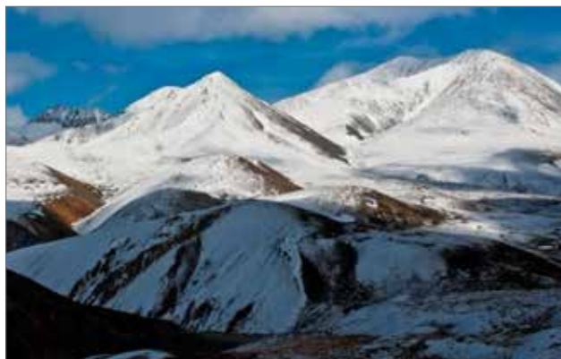
Илл. 7. Гора Победа – высшая точка Якутии.

ми мрамора более 10 миллиардов кубометров 21 . По её территории протекает маршрут оленеводов-эвенов.