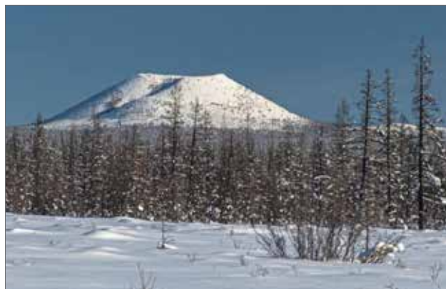
Илл. 6. Потухший вулкан Балаган-Таас.

ориентированного по широте. Его особенностью является чашеобразный кратер диаметром около 150 метров. По форме похож на якутскую юрту, отсюда произошло название.