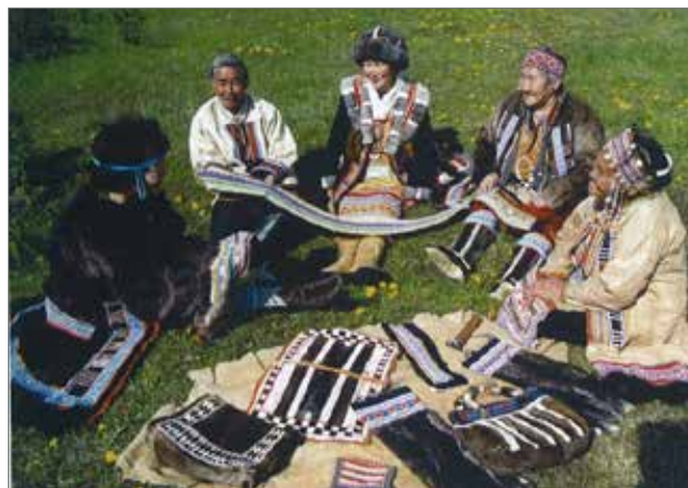
Илл.9. Эвенский костюм.

культура неотделима от оленя. Традиции выпаса, перекочевков, особое отношение к оленю как к кормильцу и священному животному — основа мироощущения. Национальная одежда эвенов — кафтаны («хэрки», «маничка»), расшитые бисером и подшейным волосом оленя, являются произведениями искусства. Каждый узор имеет свое значение и является оберегом.