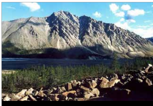
Илл. 8. Юрюнг Таастах Хайа (Мраморная гора).

ми мрамора более 10 миллиардов кубометров 21 . По её территории протекает маршрут оленеводов-эвенов.