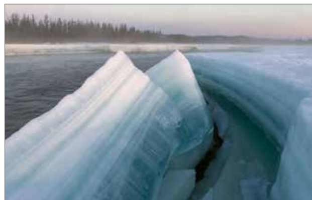
Илл. 2. Наледь Улахан-Тарын.

Изумительное ледяное поле среди летней зелени создаёт поразительно контрастный и красивый пейзаж с удивительным происхождением. Сплаваясь на лодках между высокими ледяными стенами, сковывающими реку, путешественники получают незабываемые впечатления. Благодаря этим особенностям Момская наледь привлекает туристов-спортсменов не только из России, но и со всего мира, становясь для них увлекательным и прекрасным местом посе-