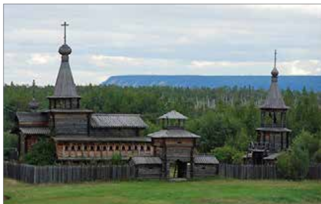
Илл. 5. Реконструированный Зашиверский острог находится в п. Соттинцы, в музее «Дружба».

На правом берегу реки Мома находится потухший вулкан «Балаган-Таас». Его высота 992 метра и расположен всего в 10 километрах от реки Момы на её правом берегу. Вулкан поднимается на 300 метров над окружающей местностью и образован вдоль тектонического разлома,