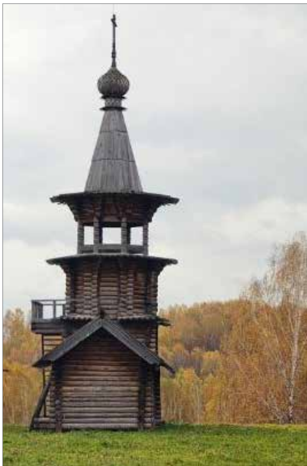
Илл.4. Звонница, перевезенная в музей Новосибирска.