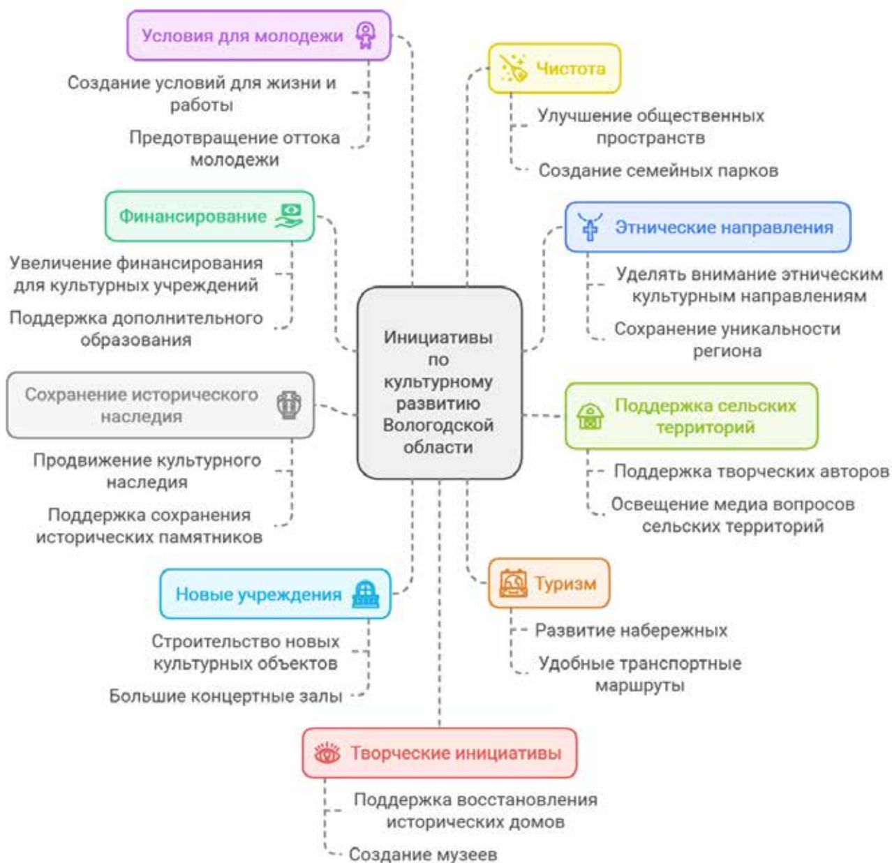
Илл. 5. Инициативы по культурному развитию Вологодской области.

7. Улучшение условий для молодежи: участники опроса подчеркивают, что необходимо создать условия для жизни и работы молодежи в регионе, чтобы предотвратить их отток в другие города.