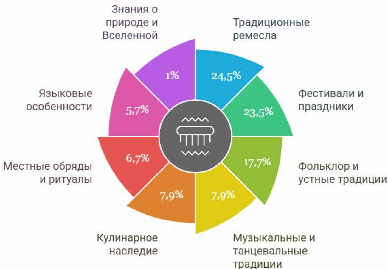
Илл. 3. Культурное наследие Вологодской области.

В рамках исследования нематериального культурного наследия респондентам было предложено выбрать не более трех объектов и явлений, являющихся, на их взгляд, визитной карточкой района.