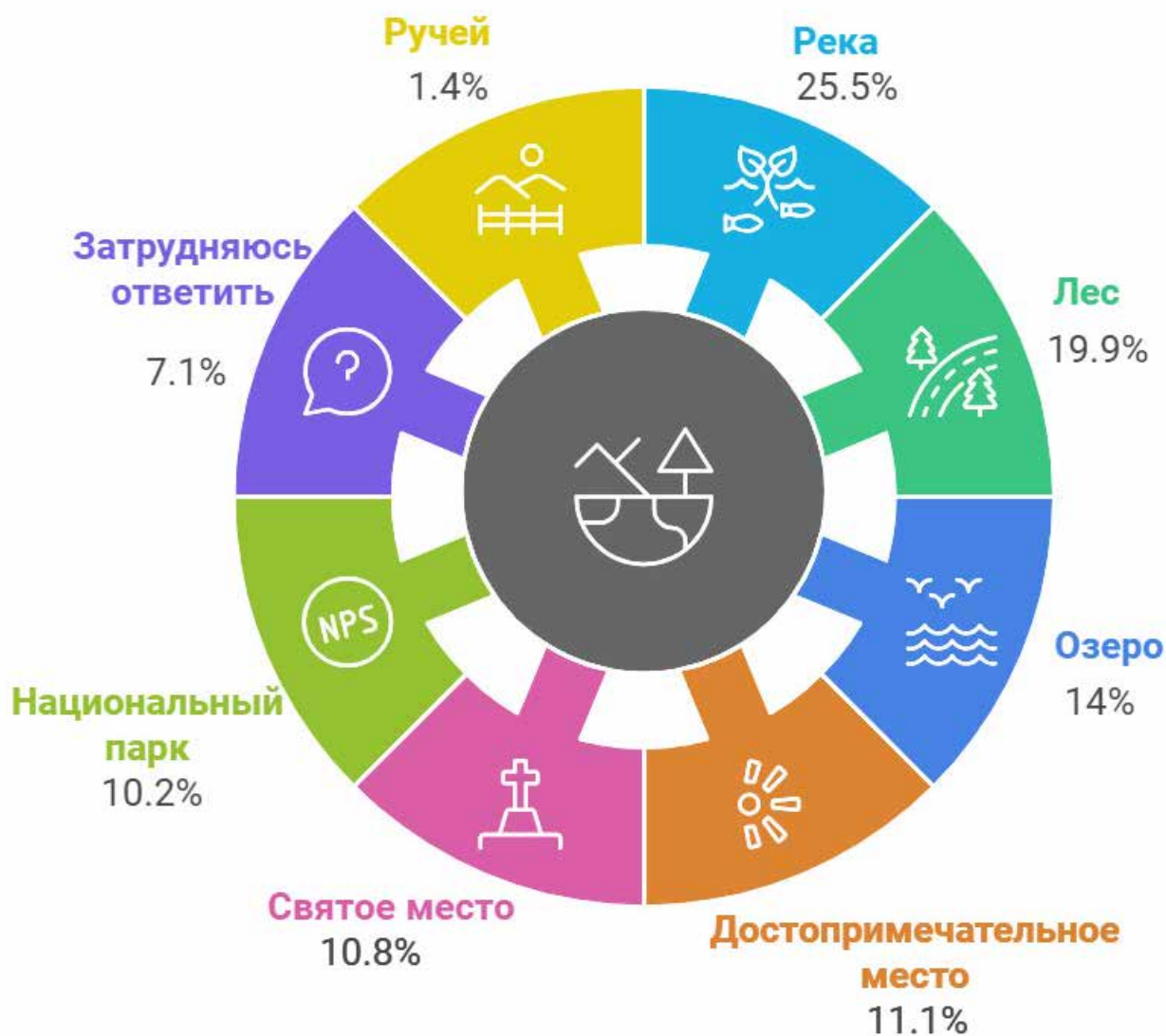
Илл. 2. Значение природных объектов для создания благоприятного образа Вологодской области.