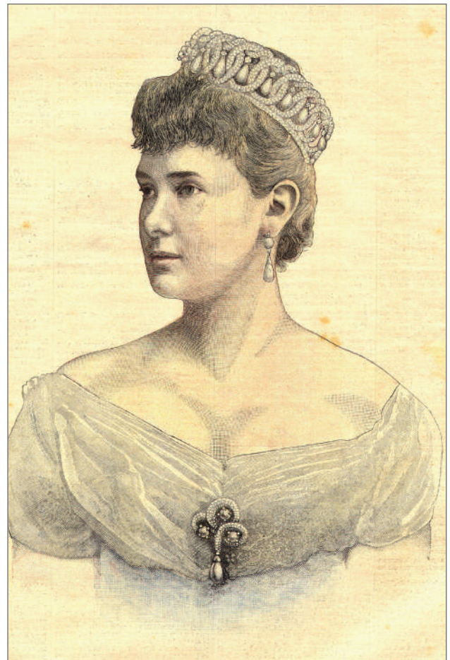
Илл.4 Великая княгиня Мария Павловна. Журнал «Le Petit Journal». 5 декабря 1891 г.