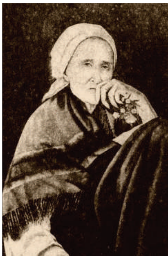
Илл. 1. Живописный портрет блаженной Пелагии Серебренниковой. Живописная мастерская Серафимо-Дивеевского монастыря*.

Отто Ренар — прусский подданный и профессиональный фотограф, открыл своё фотоателье в Москве в 1881 году, салоны О. Ренара находились в Москве, в Нижнем Новгороде и Арзамасе 17 . Авторская подпись фотографа свидетельствовала о том, что именно в этом салоне делали фотографию с единственного прижизненного живописного портрета Пелагии, которая затем размещалась на форзаце или авантитуле публикации «Сказания», изданного в Твери в 1891 году.