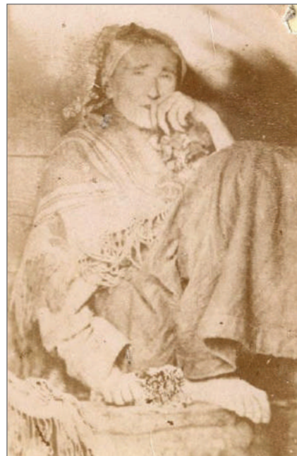
Илл. 4. Фотография блаженной Пелагии. Фотографическая мастерская Серафимо-Дивеевского монастыря. (Муромский историко-художественный музей. Архив научного отдела. (НВ-21081). На паспарту. 1880. Фотография визитного формата.)

графические, исторические, семиотические виды исследования, благодаря уникальным возможностям музейного информационного пространства, позволил использовать источниковедческие и аналитические ресурсы музейных веб-сайтов. В 2022 году в коллекции «Яндекса» «Rossianfoto» и «Мультимедиа Арт музея» появилось фотографическое изображение Пелагии Серебрянниковой, прояснившее вопросы создания художественного образа. Перед нами лицо юродивой, полное совпадение с историческими описаниями: цветы в руке, кисти рук с длинными ногтями, поза.