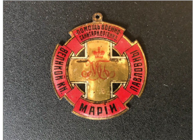
Илл.3 Благотворительный жетон «Помощь военно-санитарной организации Великой княгини Марии Павловны».