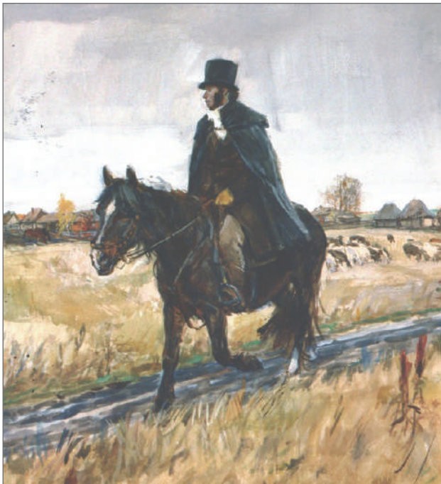
Илл. 1. «Пушкин в Болдине».

Иллюстрации А.А. Пластова к роману А.С. Пушкина, над которыми он работал с 1948 года, недавно были опубликованы полностью, включая наброски к неосуществлённым иллюстрациям 6 . Открывает книгу репродукция картины 1949 года «Пушкин в Болдине» (илл. 1): поэт изображён обзеревающим окрестности на коне.