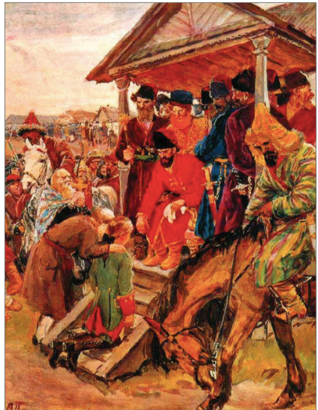
Илл. 2. «Суд Пугачёва».

Пластов ещё в 1920-е годы задумал огромную станковую картину «Суд Пугачёва»: этот замысел не был реализован, но была создана иллюстрация (Илл. 2)