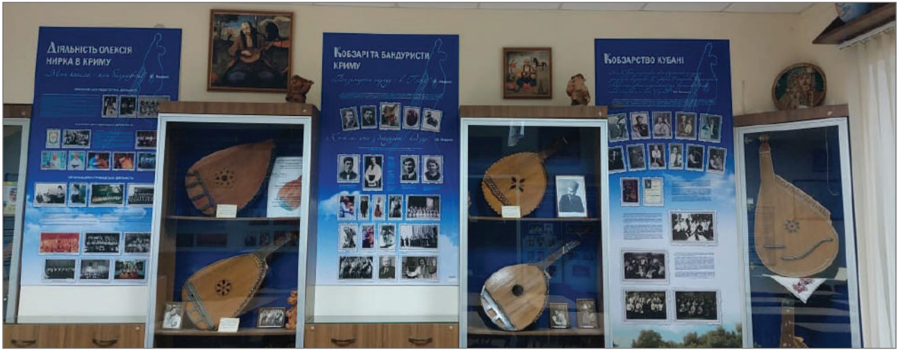
Илл. 5. Музей кобзарства Крыма и Кубани 2024 г.

ные сборники, программы и афиши концертов, музыкальные записи, скульптурные миниатюры, рушники — всего более 500 экспонатов, что позволило репрезентовать данную коллекцию в качестве уникального экспозиционного материала 3 . В последующие годы музейная экспозиция пополнялась благодаря продолжению активной поисковой деятельности А.Ф. Нырко, его экспедиционным поездкам, общению с потомками мастеров-бандуристов, работе с архивными документами.