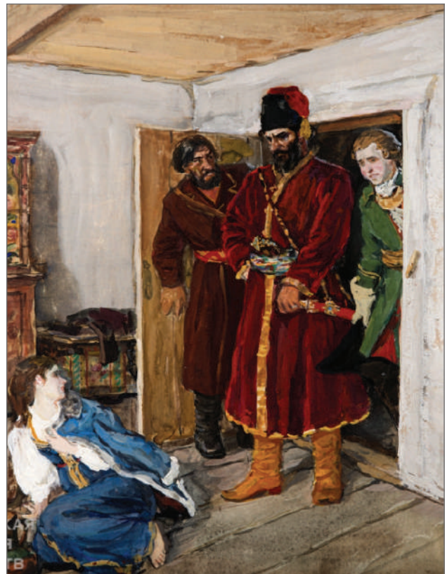
Илл. 3. Сцена освобождения Маши.

Замечательно, что сцену освобождения Маши Аркадий Пластов изобразил необычно (Илл. 3).