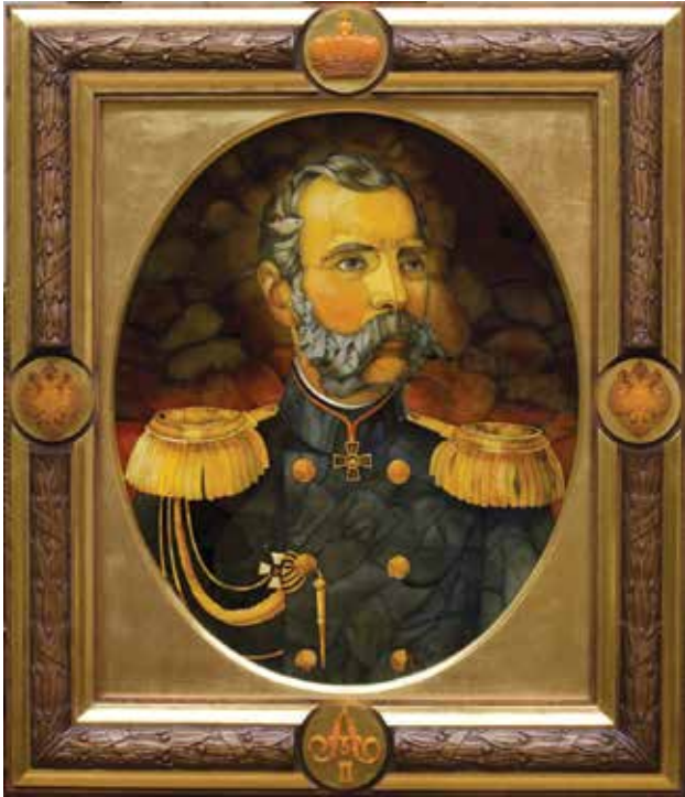
Фото 5. Александр Журавлев. Портрет Александра II. Янтарь. Размер 57х44 см, 2009 г.

ность в электронной форме обмениваться опытом, «людей посмотреть и себя показать», цифровые способы общения оказывают влияние на современные технологии и в области самопрезентации художников 5 .