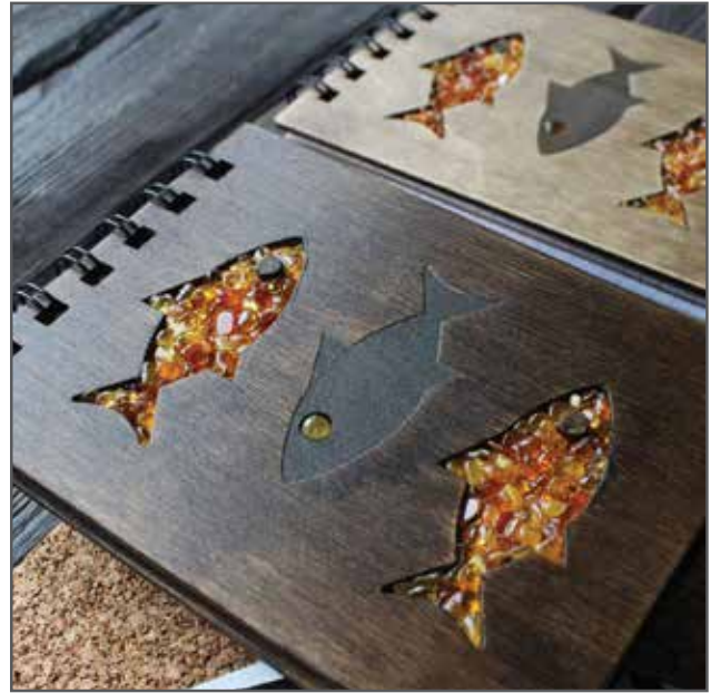
Фото 1. Блокноты и ежедневники с янтарем производства @amber.two, г. Калининград.

Для Польши и стран Балтии, пожалуй, вопрос о формировании современного стиля в изготовлении янтарных предметов не стоит так остро – развитие янтарного дела в этих регионах шло эволюционным путем, стиль работы янтарщиков менялся постепенно, следуя веяниям времени и моде. У российского потребителя нет понимания сути и ценности этого материала: до сих пор можно услышат удивленные возгласы – мол, янтарь на пляже лопатой можно накопать, а обработать и того проще. За исключением работ петербургских мастеров и калининградских, мало кто в России может