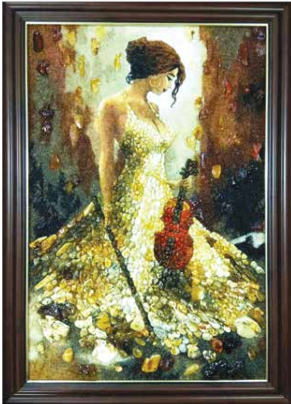
Фото 2. Валерий Лагун. Девушка в белом. Янтарь. Размер 30х45 см. Галерея янтарных картин, г. Калининград.

портретного творчества 18-19 вв. (камеи с изображением европейских монархов). Масштабная добыча янтаря сделала этот материал доступным для широкой публики и предоставили современным мастерам возможность работать в новых жанрах, соединяя янтарь с другими материалами, создавая небывалые, причудливые образы. (Фото 3,4).