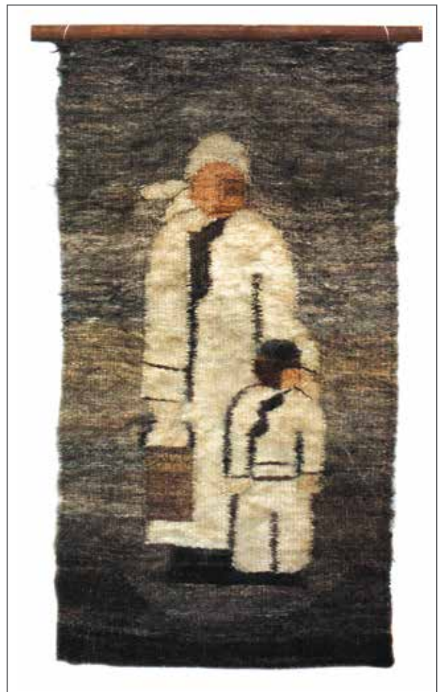
Фото 4. «Бабушка с внуком» (180×110), 1991 г. Гобелен, ручное ткачество, сарлычий волос. Источник: Художники Бурятии. Улан-Удэ: Принтлето, 2018. 168 с.