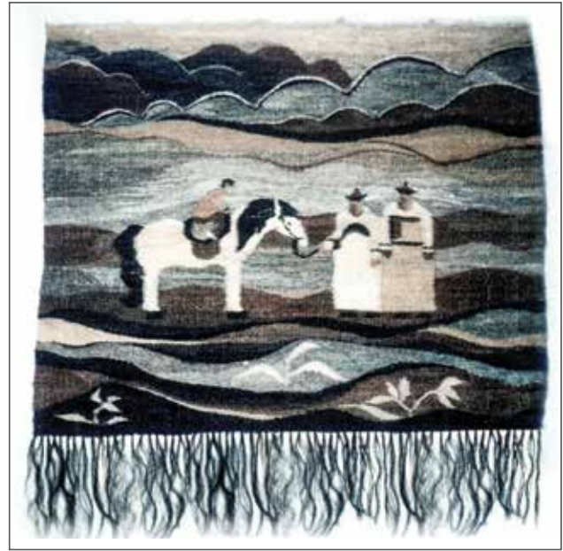
Фото 2. «Семья» (220×250 см), 1985 г. Гобелен, ручное ткачество, конский волос.

Композиция построена так, что зритель ощущает бесконечность горизонтальных плавных линий очертаний холмов, движение облаков. На переднем плане линейную композицию образуют главные фигуры: мальчик на лошади, отец, мать.