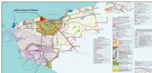
Фото 1. Генеральный план Таманского сельского поселения Темрюкского района. Карта планируемого размещения объектов местного значения. М 1: 25000. Администрация Таманского сельского поселения Темрюкского района. На карте отмечено местоположение «Выставочного комплекса «Атамань» [Электронный ресурс]. URL: http://адм-тамань.рф/index.php/nasha-taman/nasha-taman-6 (дата обращения 12.02.2020).

няшний момент объектов на территории поселения. Парк этнографической реконструкции расположен непосредственно в станице Тамань, на берегу Таманского залива и одноименного полуострова на историческом месте (приблизительно). Государственное автономное учреждение культуры Краснодарского края «Выставочный комплекс «Атамань» располагается по адресу: Краснодарский край, Темрюкский район, Станица Тамань, улица Лебедева, 102. (Фото 1).