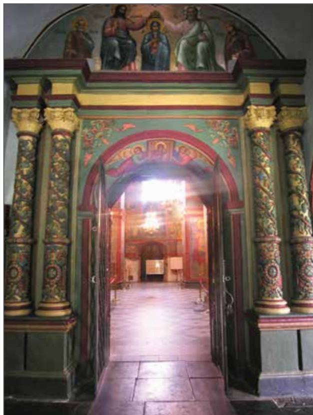
Фото 3. Интерьер храма. Портал северного входа из галереи в четверик Смоленского собора Новодевичьего монастыря в г. Москве, 2015 г.

Обратим внимание на то, что с 1927 года музей претерпевал реорганизацию. В этих условиях Смоленский собор продолжал работать и осматривался посетителями как архитектурный объект XVI в. Музейные специалисты, в свою очередь, контролировали состояние живописи и конструкций церкви. До 1928 года храм совмещал музейную и церковную функции, поскольку в нем «периодически совершались