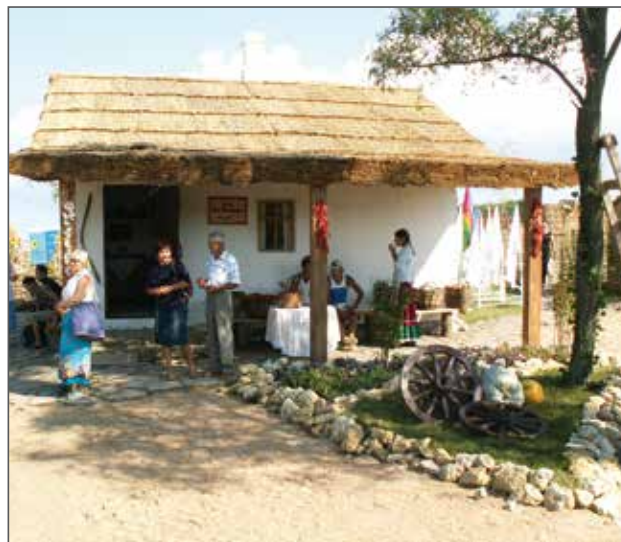
Фото 2. «Выставочный комплекс «Атамань». Воссозданное подворье станицы.

подворий, включающее подлинные вещи, имеющие музейное значение были собраны в станицах Краснодарского края. На первом этапе своей работы парк включал несколько этнодворов, ярмарочную площадь. На открытии комплекса выступали фольклорные коллективы (Фото 3), проводились различные конкурсы для детей, осуществлялась торговля сувенирами и дегустация традиционных блюд.