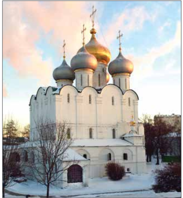
Фото 1. Смоленский собор Новодевичьего монастыря в г. Москве. Южный фасад, 2015 г.

В конце XIX – начале XX века стало очевидным, что храм нуждается в профессиональном