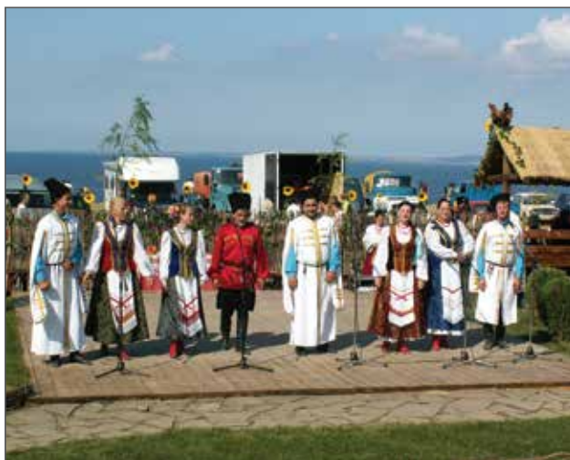
Фото 3. «Выставочный комплекс «Атамань». Выступление фольклорного коллектива.

реконструкция обрядов кубанского казачества. 6 Комплекс ориентирован на туристов и отдыхающих, с каждым годом увеличивается набор услуг, представляемых посетителям. Благодаря теплему климату, парк открыт практически круглогодично, фестивали проходят ежегодно на постоянной основе, в основном летом и осенью.