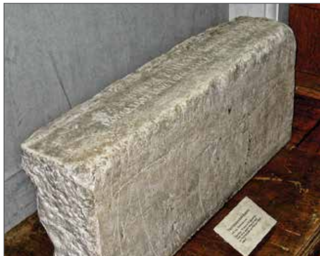
Фото 4. «Тмутараканский камень».

тельными функциями, функции патриотического воспитания населения, укрепления духовно-нравственных основ российского общества, повышение уровня знания отечественной истории и культуры.