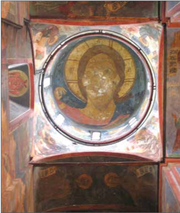
Фото 2. Фрески центрального купола Смоленского собора Новодевичьего монастыря в г. Москве, 2015 г.

Синод. А для наблюдения за реставрацией археологическое общество назначало комиссию.