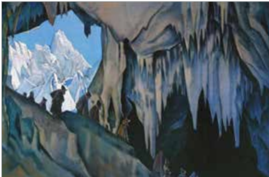
Илл. 12. Рерих Н. Чудь подземная (Чудь под землю ушла). 1928-30.

множество этюдов с натуры, дошли до настоящего времени только триерих для подтверждения своей гипотезы об истоках евроазиатской культуры организовал Трансгималайскую экспедицию (Алтай-Гималаи). Содержательно экспедиция была очень разносторонней: археология, геология, флора, фауна, духовная и материальная культура народов, населяющих территорию. Помимо этого, алтайский период экспедиции оказался плодотворным не только в научном, но и в художественном плане. В настоящее время атрибутировано 48 работ алтайского цикла 17 . Это — «Белуха. Алтай» (1926), «Белуха» (1926). Вместе с тем наиболее известные картины были написаны по впечатлениям от пребывания на Алтае. Некоторые, как, например, «Ойрот — вестник белого Бурхана», были задуманы до путешествия, некоторые имеют несколько вариантов («Чудь подземная», 1913; «Чудь подземная (Чудь под землю ушла), 1928–30 е гг.), большое число работ написано уже после путешествия (Илл.12.) 18 .