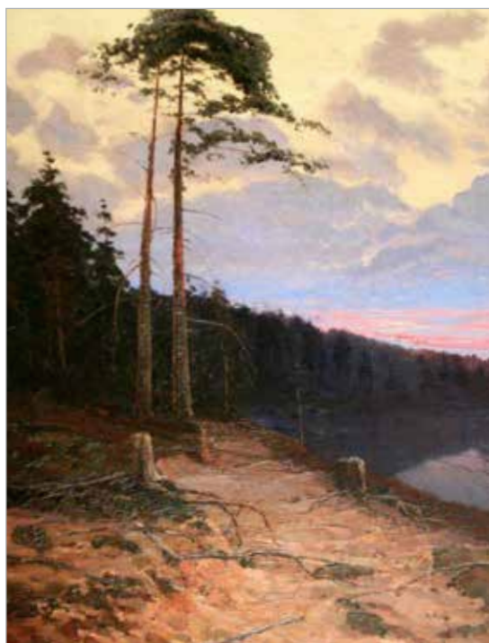
Илл.5. Вучичевич-Сибирский В. Сосны на берегу. 1910-е гг.

страстным путешественником, в своих поездках он писал Урал и Сибирь — от Алтая до Байкала. К сожалению, большая часть творческого наследия В. Вучичевича-Сибирского погибла или пропала во время его трагической гибели. В настоящее время в художественном музее Алтайского края хранятся две работы — «Пейзаж с мельницей» и «Сосны на берегу реки», последняя относится к завершающему периоду творчества художника (Илл.5.) 8 .