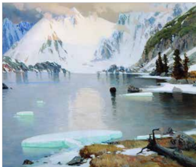
Илл.10. Гуркин Г. Озеро горных духов. 1910.

Собственное мировоззрение, основанное на древних сказаниях, мифах и легендах алтайского народа, художник иллюстрировал пейзажными картинами. Они стали способом передачи