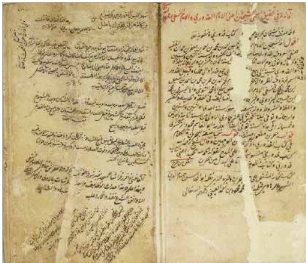
Фрагмент произведения «Мухтасар аль-Кудури». Список 1834 г.

Следующим примечательным произведением является « الهداية » «Аль-хидаят» («Истинный путь») — своего рода комментарий к основным правовым принципам, отраженным в произведении «Мухтасар». Составитель — Бурхануддин Али Маргинани (ум. в 1197 г.). «Аль-хидаят» составлен на основе сочинений Мухаммада аш-Шайбани («Малый сборник») и Абу аль-Хусайна аль-Кудури («Мухтасар аль-Кудури»). Труд больше всего известен как отдельное произведение, а не комментарий. Это объясняется тем, что по сравнению с другими произведениями в «Аль-хидаят» более подробно раскрываются темы, связанные с разделением наследства, земельным правом и т. д.