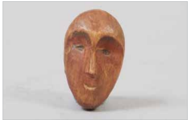
Илл. 6. Маска. Из коллекции Э. Нельсона, 1878. Дерево (?), резьба. Национальный музей естественной истории Смитсоновского института.

вок — редуцированную антропоморфную фигурку (Илл.6).