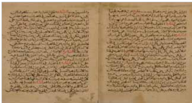
Фрагмент произведения «Зубдат аль-асрар шарх мухтасар аль-манар». Список нач. XIX в. Переписчик Мустаким ибн Садр ад-Дином.

ния — ас-Сиваси, Абу ас-Сана'и Ахмед б. Мухаммед Абу Баракат аз-Зили (ум. в 1562 г.). В фонде ОРРИ НБ РБ переписки данного произведения представлены в пяти экземплярах: 1) переписан в 1874 г. 51 Халилуллой Зайнетдином в д. Куганак-баш, медресе Тимур-бека; 2) переписан в XIX в. 52 ; 3) переписан в XIX в. Мухаммадом Хасаном ибн Салимгареем 53 ; 4) переписан в XIX в. Мустакимом ибн Садр ад-Дином 54 ; 5) переписан в 1887 г. 55 .