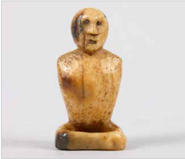
Илл. 4. Поясная пуговица. Из коллекции Э. Нельсона, 1880. Клык моржа, резьба, гравировка. Национальный музей естественной истории Смитсоновского института.