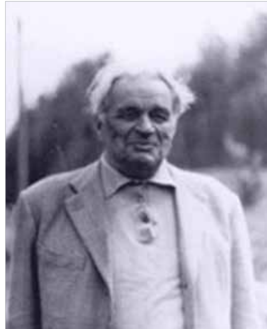
Илл. 2. Фотопортрет художника Фёдора Сергеевича Булгакова в пожилом возрасте.

Федор Булгаков самостоятельно является к Михаилу Васильевичу Нестерову с вопросами о советах в живописи, памятуя и ссылаясь на то, что Нестеров писал портрет его отца; а по ходатайствам и рекомендациям великого русского и советского художника Бориса Михайловича Кустодиева (1878, Астрахань, Российская империя — 1927, Ленинград, СССР) Фёдор в 21-ин поступает и учится в частной рисовальной студии известного и прекрасного педагога Дмитрия Николаевича Кардовского (1866, Осурово, Российская импе-