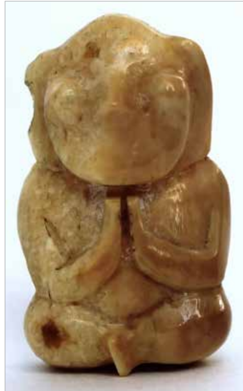
Илл. 9. Пеликен. Чукотка, конец XX в. Клык моржа, резьба. Поронайский краеведческий музей.

В дневниковых записях А.Л. Горбунков указывал, что пеликены имеют тесную связь с танцевально-ритуальной культурой чукчей и эскимосов 31 . Художник не даёт развернутого пояснения своей гипотезы, однако вполне понятно, что речь шла об исполнении ритуального танца на Празднике кита, который устраивали всякий раз, когда группе охотников на морского зверя удавалось добыть кита 32 . Горбунков полагал, что пеликен — это стилизованный образ отдыхающего танцора или певца-ярариста. Предположение Горбункова, что это танцор или музыкант — вполне допустимо. Тем более что в Празднике кита принимали участие все жители селения, включая женщин. Вместе с тем, с художественным руководителем нельзя согласиться в том, что это именно отдыхающий танцор. Праздник кита — это в принципе сидячий танец, потому