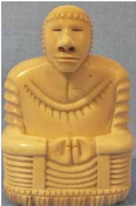
Илл. 8. Пеликен. Чукотка, 1930-е. Клык моржа, резьба. Сергиево-Посадский историко-художественный музей-заповедник.

пец Моисей Караев утверждал, что это именно он «привнес их в промысел» чукчей и эскимосов из Шанхая 30 . К примеру, в Сергиево-Посадском историко-художественном музее-заповеднике хранится скульптура пеликена из моржового клыка, вырезанная на Чукотке в 1930-е гг. Очевидно, что неизвестный мастер, создавший эту фигурку, был знаком с иконографией китайских и индийских божеств (Илл. 8).