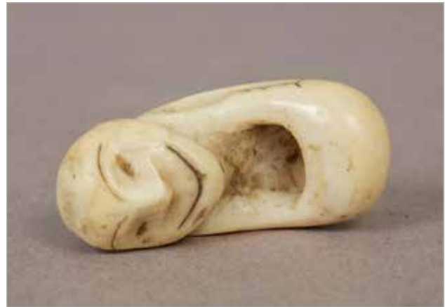
Илл. 3. Пряжка для шнура. Из коллекции Э. Нельсона, 1879. Клык моржа, резьба, гравировка. Национальный музей естественной истории Смитсоновского института.

явленные советскими исследователями при раскопках могильников на территории Чукотки в XX веке. Так, в могильниках Уэлена (погребение 1–3, 7, 9–10, 14–15, 17, 19, 22) 8 , Чини (погребение 38, 40, 54, 70) 9 и Эквена (погребение 7–8,