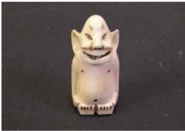
Илл. 1. Пеликен. Чукотка (?), 1924. Клык моржа, резьба, гравировка. Российский этнографический музей.

На территории Чукотки пеликена иногда называют по-эскимосски тупчак, что означает «чёрт», «нечистый дух», «шаман», «посредник», по-чукотски его название звучит как келекай, что в переводе значит «божок» 2 . Как отмечал в своих дневниковых записях Александр Леонидович Горбунков, профессиональный художник, работавший руководителем косторезных мастерских на Чукотке в 1930-е гг., к моменту его приезда на Чукотке не было такого мастера, который бы не резал пеликенов 3 .