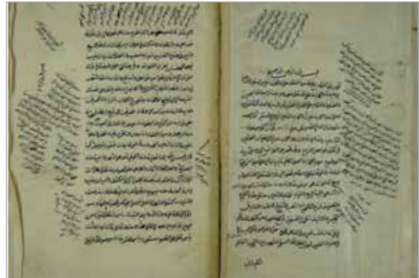
Фрагмент произведения «Фихр аль-Кайдани». Список 1857 г.