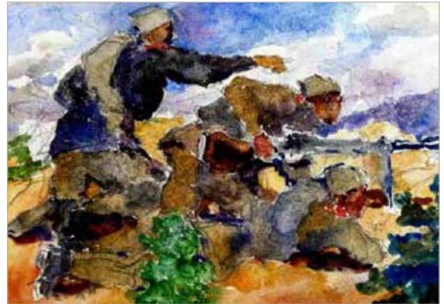
Илл. 4. Фёдор Сергеевич Булгаков «Пулемётный огонь», 1943, музей-заповедник «Абрамцево»..