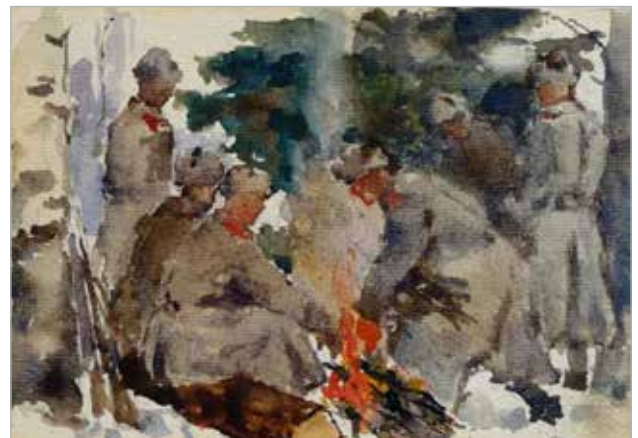
Илл. 5. Фёдор Сергеевич Булгаков «Привал», 1943, музей-заповедник «Абрамцево».