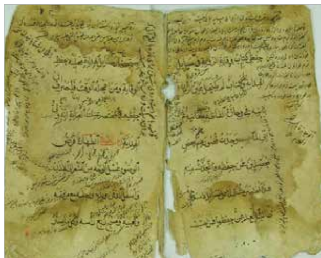
Фрагмент произведения «Мухтасар аль-викаят фи масаил аль-хидаят». Список 1793 г.

ставлен в десяти экземплярах. Самый ранний из них переписан в 1626 г. переписчиком Мурадом ибн Даудом ибн Хабилом 20 . Остальные переписаны в 1706 г. 21 , в 1797 г. 22 , в 1843 г. 23 , в 1854 г. 24 , в 1869 г. 25 и в 1826 г. 26 . В фонде ОРК НБ УФИЦ РАН «Мухтасар «Аль-викаят» представлен в двух экземплярах. Один из них переписан в 1826 г. 27 , другой — в 1856 г. 28 .