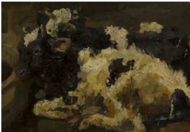
Илл. 8. Фёдор Сергеевич Булгаков «Коровы», опубликовано галереей «НИКА».

Булгаков, как и многие советские художники, сейчас — часто продаётся на аукционах, таких, как «СОВКОМ», «ARTinvestment.RU», «Галерея Леонида Шишкина» и других, ставших для нас и изучения истории искусств её бурлящими источниками, и, как и другие, Булгаков преподносит нам сюрпризы своими произведениями, говорящими о том, как мало и плохо мы знаем культуру, жизнь и живопись СССР, где родились и трудились, — вот, как к примеру, замечательный, мощный и очень благородный по колористическому звуку натурный, свежий по экспрессии и мазку живописный этюд «Коровы» (19,0x29,0 см — другие каталожные данные не приводятся), помещённый в раздел «анималистики» Советских художников одесской «Галереи Ника» (Илл. 8). 13