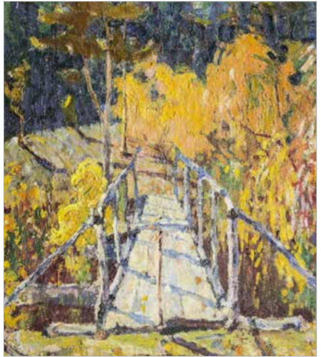
Илл. 8. Коровай Е. Мостик в лесу. 1916.

В творческом наследии барнаульского художника А. Никулина значительная часть работ посвящена родным местам. В 1920-е гг. художник переехал из Сибири в Центральную Россию, но связь с родным городом не потерял. Вдохновившись импрессионистическими взглядами на живопись во время учебы в Центральном училище технического рисования барона Штиглица, он одним из первых привнес эту живописную тенденцию на алтайскую землю. Его работы отличает богатство цвета, яркость, даже некоторая декоративность. Пленэрные живописные этюды