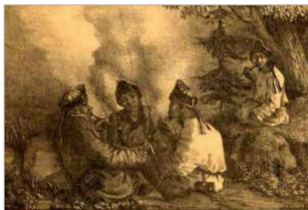
Илл. 2. Кошаров П. Группа алтайцев-телеутов. 1889.

Несколько лет подряд в летний период художник ездил на Алтай, откуда привозил этюды, альбомы с пейзажами, этнографические зарисовки и картины. Две из них были выставлены впоследствии в Академии художеств, а их автор «удостоен похвалы» 3 . В 1882 г. в зале Томской городской думы состоялась тематическая персональная выставка Кошарова «Виды Алтая». Неоднократно в качестве ученого рисовальщика он был командирован и в научные экспедиции по Алтаю 4 . Его рисунки и живописные работы передают эпичность этой местности, этнографические зарисовки выполнены с предельной детализацией (Илл.2.).