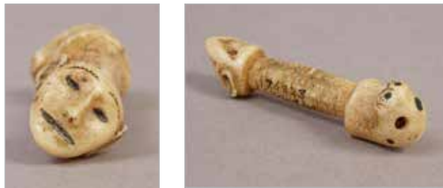
Илл. 5а, 5б. Костяной предмет. Из коллекции Э. Нельсона, 1897. Клык моржа, резьба, гравировка. Национальный музей естественной истории Смитсоновского института.

Такие духи-хранители давали ребёнку двойное охранение 19 .